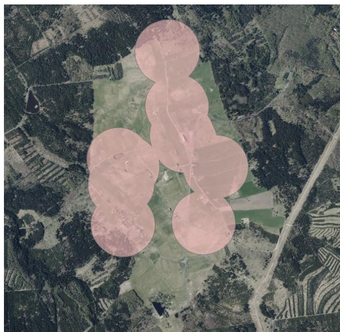
Malý Háj a Rudolice v Horách