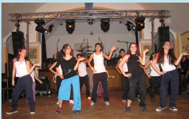
děti z DD Hora Svaté Kateřiny