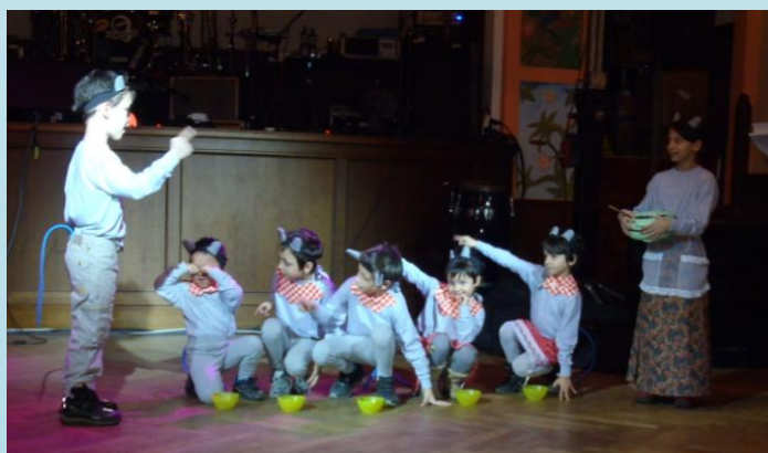
děti z DD Chomutov